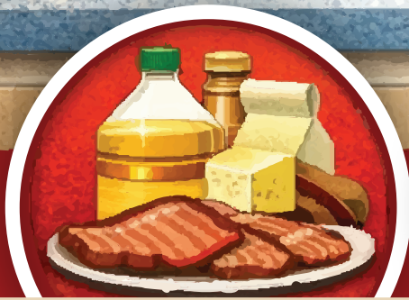
FATS, OILS & GREASE