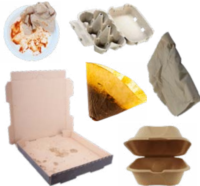
PAPEL NO ESTUCADO SUCIO