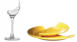
VIDRIO ROTO Y CERÁMICA