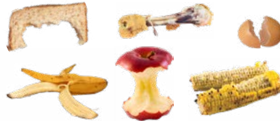
RESTOS DE COMIDA

2. Vacíelo cada uno o dos días en su contenedor de compostaje. Utilice el bote para transportar el papel no estucado sucio y los restos de comida al contenedor de orgánicos.