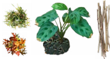
RESIDUOS DE JARDÍN

*Evite cargos por contaminación: mantenga los siguientes artículos fuera del reciclaje.