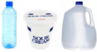
BOTELLAS, BOTES Y JARRAS DE PLÁSTICO