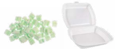
ESPUMA DE EMBALAJE Y POLIESTIRENO