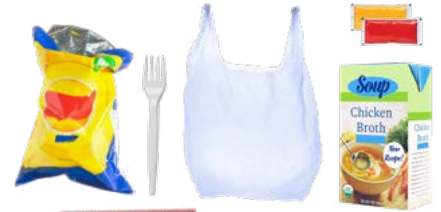
PLÁSTICO DE UN SOLO USO