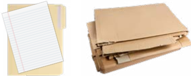
PAPEL Y CARTÓN