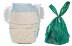
PAÑALES Y RESIDUOS DE MASCOTAS