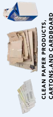
CLEAN PAPER PRODUCTS, CARTONS, AND CARDBOARD