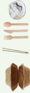
UNCOATED SOILED PAPER AND WOODEN UTENSILS