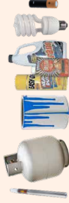
VAPE PENS, PROPANE TANKS, PAINT, CHEMICALS, BULBS, BATTERIES

Household Hazardous Waste is extremely dangerous to sanitation workers and cannot be disposed of in curbside service. Zero Waste Marin has several options for the proper disposal of household hazardous waste. Visit marinhhw.gov or call 415.485.6806 to learn more.