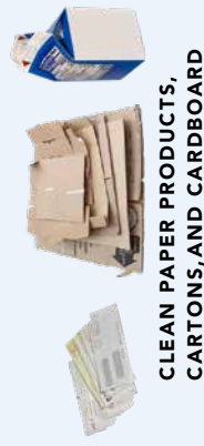
CLEAN PAPER PRODUCTS, CARTONS, AND CARDBOARD