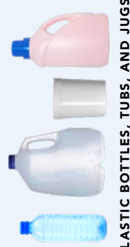
PLASTIC BOTTLES, TUBS, AND JUGS