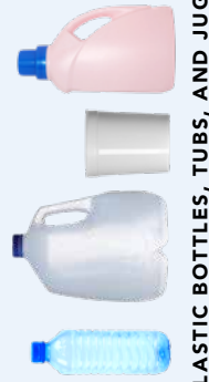
PLASTIC BOTTLES, TUBS, AND JUGS