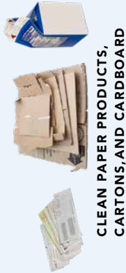
CLEAN PAPER PRODUCTS, CARTONS, AND CARDBOARD