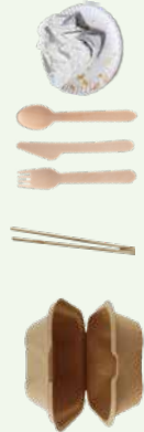
UNCOATED SOILED PAPER AND WOODEN UTENSILS