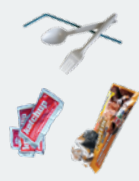
SINGLE USE PLASTICS