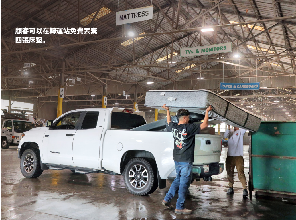
顧客可以在轉運站免費丟棄四張床墊。

無法前往轉運站的居民可在我們的網站上預約大件物品回收，來回收床墊。前往 recology.com 。按一下 [所有服務] 索引標籤，然後按一下 [大件物品]。