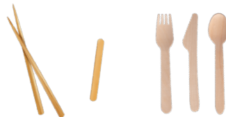
CHOPSTICKS, STIR STICKS, AND WOODEN UTENSILS PALILLOS MESCLADORES, PALILLOS Y UTENSILIOS DE MADERA