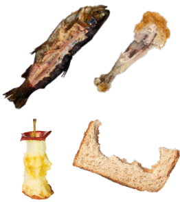
FOOD SCRAPS RESTOS DE COMIDA