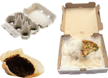
UNCOATED SOILED PAPER PAPEL SUCIO SIN RECUBRIMIENTO