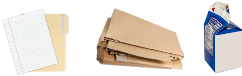
PAPER, FLATTENED CARDBOARD, AND CARTONS PAPEL, CARTÓN PLANO Y CARTONES