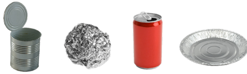
FOOD-GRADE METAL METAL DE CALIDAD ALIMENTARIA METAL