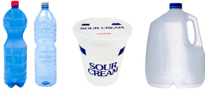
PLASTIC BOTTLES, TUBS, AND JUGS BOTELLAS, BALDES Y JARRAS DE PLÁSTICO

Recyclables must be empty, clean and dry Reciclables deben estar vacíos, limpios y secos