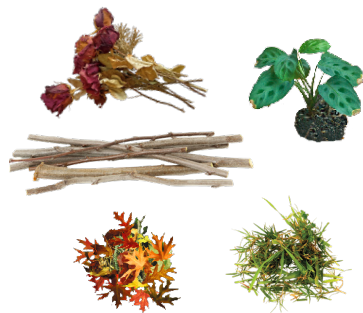
PLANT TRIMMINGS RECORTES DE PLANTAS