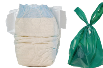
PAÑALES Y DESECHOS DE MASCOTAS