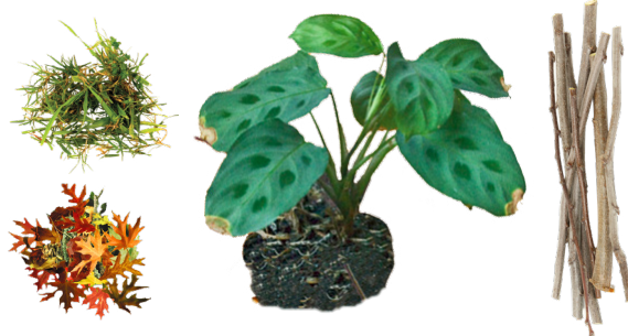
DESECHOS DE JARDÍN