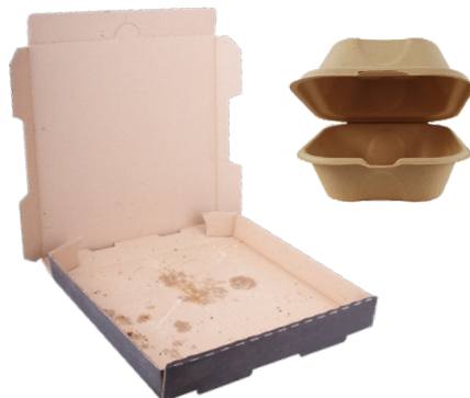
PAPEL SUCIO SIN RECUBRIMIENTO