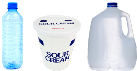
BOTELLAS, BALDES Y JARRAS DE PLÁSTICO