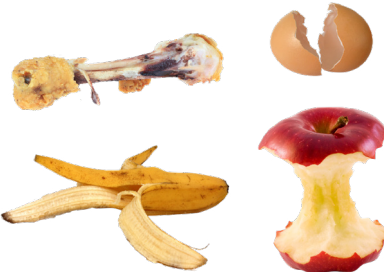
RESTOS DE COMIDA