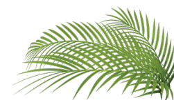
ADELFA Y HOJAS DE PALMERA