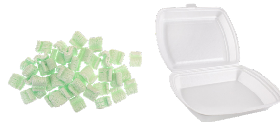
ESPUMA DE EMBALAJE Y POLIESTIRENO