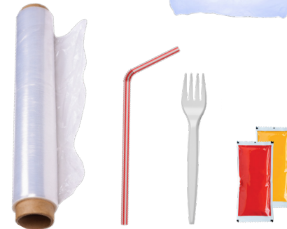
PLÁSTICO DE UN SOLO USO