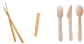
CHOPSTICKS, STIR STICKS, AND WOODEN UTENSILS PALILLOS MESCCLADORES, PALILLOS Y UTENSILIOS DE MADERA