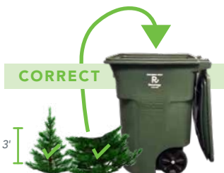
CUT TREE TO FIT