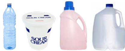
PLASTIC BOTTLES, TUBS, AND JUGS BOTELLAS, BALDES Y JARRAS DE PLÁSTICO