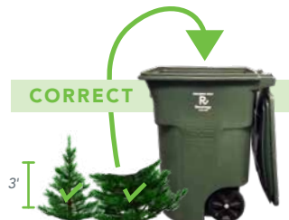
CUT TREE TO FIT