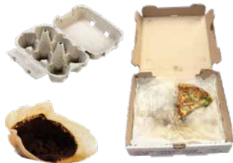
UNCOATED SOILED PAPER PAPEL SUCIO SIN RECUBRIMIENTO