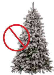
NO FLOCKED TREES

La recolección de árboles navideños en la acera se llevará a cabo del 2 al 6 de Enero el día de su servicio. Después de estas fechas, los árboles se pueden cortar para que quepan dentro de su carrito verde con la tapa cerrada, para recogerlos en su día habitual de servicio. Entrega disponible: Estación de bomberos de Cotati en 1 East Cotati Ave, del 26 de Diciembre al 12 de Enero.