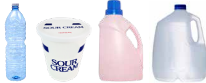
PLASTIC BOTTLES, TUBS, AND JUGS BOTELLAS, BALDES Y JARRAS DE PLÁSTICO