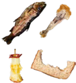
FOOD SCRAPS RESTOS DE COMIDA