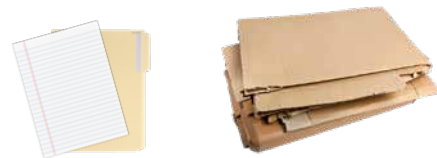
PAPER, FLATTENED CARDBOARD, AND CARTONS PAPEL, CARTÓN PLANO Y CARTONES

ANSWERS: 1. Compostable cup = Trash, 2. Soiled paper plate and napkin = Compost, 3. Plastic package = Recycling, 4. Ice cream carton = Recycling