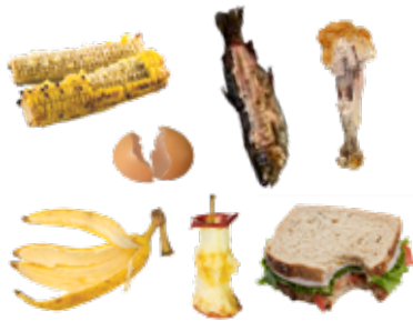
FOOD SCRAPS RESTOS DE COMIDA