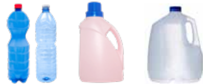
PLASTIC BOTTLES, TUBS, AND JUGS BOTELLAS, BALDES Y JARRAS DE PLÁSTICO