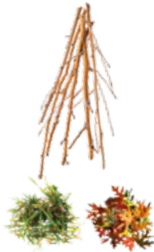
PLANT TRIMMINGS DESECHOS DE JARDÍN