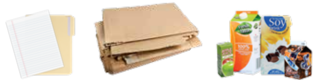
PAPER, FLATTENED CARDBOARD, AND CARTONS PAPEL, CARTÓN PLANO Y CARTONES

Don't know where something goes? ¿No sabes en dónde van las cosas?