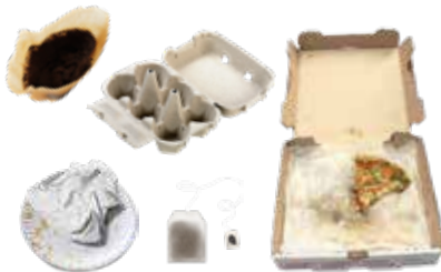
UNCOATED SOILED PAPER PAPEL SUCIO SIN RECUBRIMIENTO