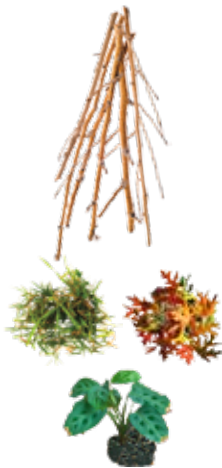
PLANT TRIMMINGS DESECHOS DE JARDÍN