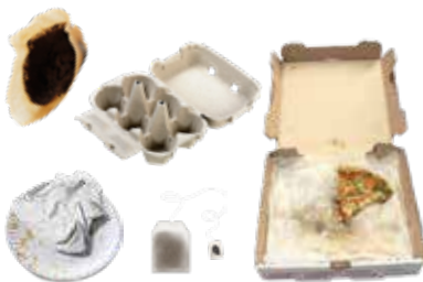
UNCOATED SOILED PAPER PAPEL SUCIO SIN RECUBRIMIENTO