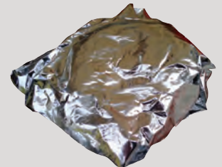
Giấy Bạc Bẩn