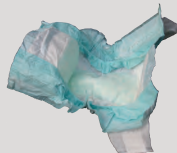
Tã và Chất Thái Thú Nuôi