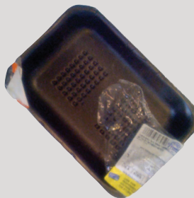
Khay Bằng Xốp