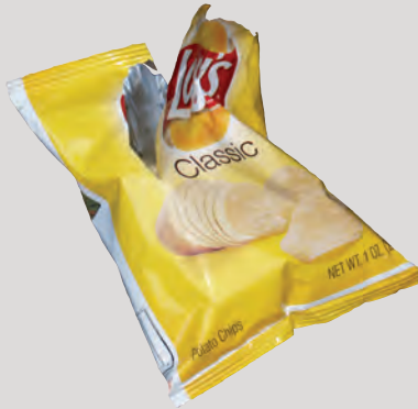
Túi Đựng Đồ Ăn Nhẹ