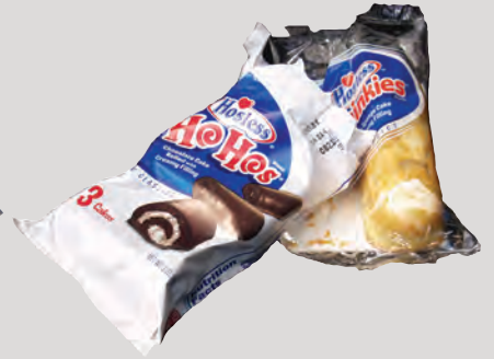
ក្រដាសញាស្តិកខ្ទប់