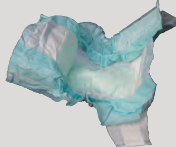
កន្ទបលាមកកូនក្មេងនិងលាមកសត្វចិញ្ចឹម