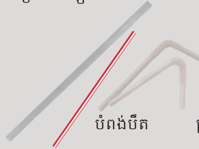
បំពង់បឺត