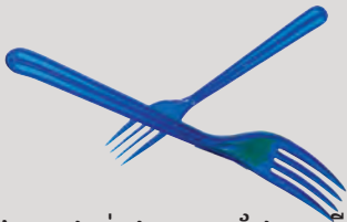
គ្រឿងប្រដាប់ផ្ទះបាយដែលធ្វើពីប្លាស្ទិកដែលគេបោះចោល