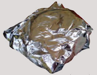
ក្រដាសខ្ទប់សម្រាប់អាំងត្រីជាតិលោហៈដែលអាចកប់ដីបាន