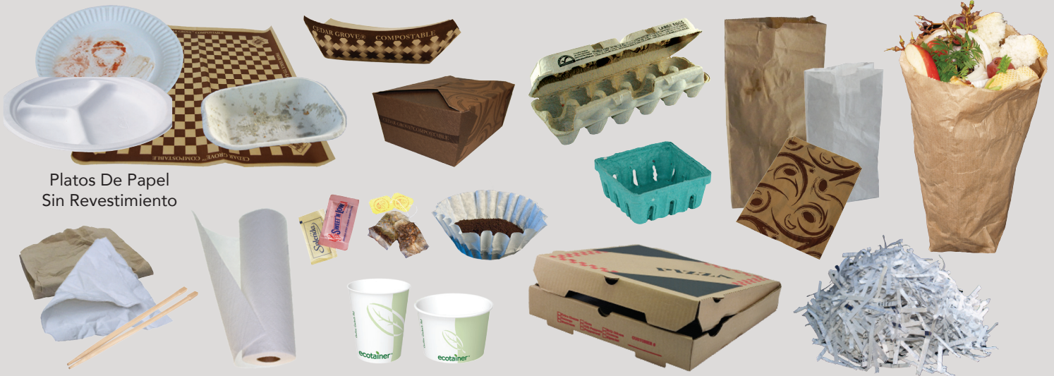
Platos De Papel Sin Revestimiento