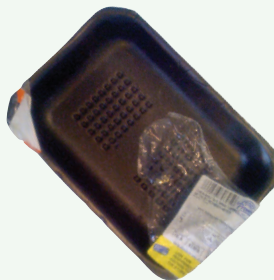
Khay Bằng Xốp