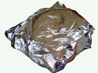
Giấy Bạc Bẩn