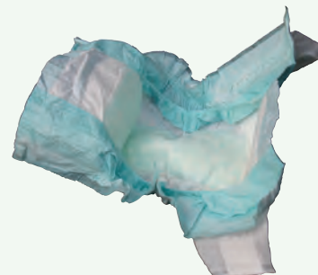
Tã và Chất Thái Thú Nuôi