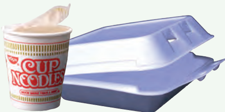
Hộp Đựng Bằng Xốp