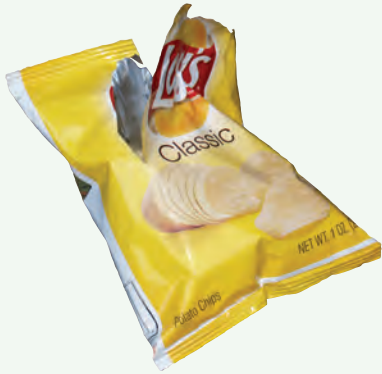
Túi Đựng Đồ Ăn Nhẹ